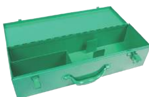
Obj. č. 5201000 Transportní box