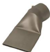
Obj. č. 5107266 Tryska přeplátovací 75x2 mm, ErOn