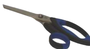
Obj. č. 5200810 Nůžky na fólie