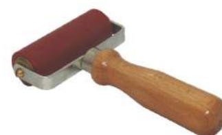
Obj. č. 5106974 Přítlačný váleček 80 mm (silikon)